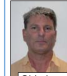
Chimie Alain Deleau