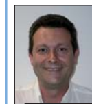
Eclairage Joseph Gomez Henri