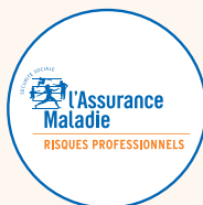
CPAM ou CGSS/CSS en outre-mer